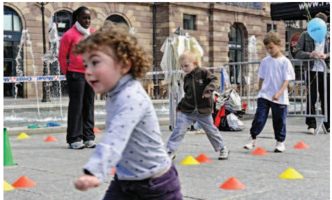
De nombreux enfants sont venus essayer le parcours d'initiation à l'athlétisme.

■ Samedi, l'Office des sports, les associations et les ligues sportives d'Alsace ont organisé une journée d'animations sur la place Kléber à Strasbourg. L'objectif était de promouvoir le sport et les courses de Strasbourg, qui auront lieu les 14 et 15 mai, auprès d'un public de passage.